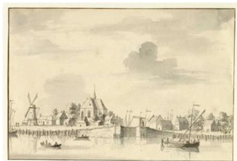
Gezicht over de Lek op het dorp Vreeswijk met in het midden de sluis. Rond 1730 getekend door L.P. Serrurier

Uiteraard was er ook een foto van scheepswerf Buitenweg, dat we nu kennen als de Museumwerf. We eindigden bij de Oude Sluis, dat nu als vaste waterkering dienstdoet, maar op oude foto's nog als schutsluis dienst deed.